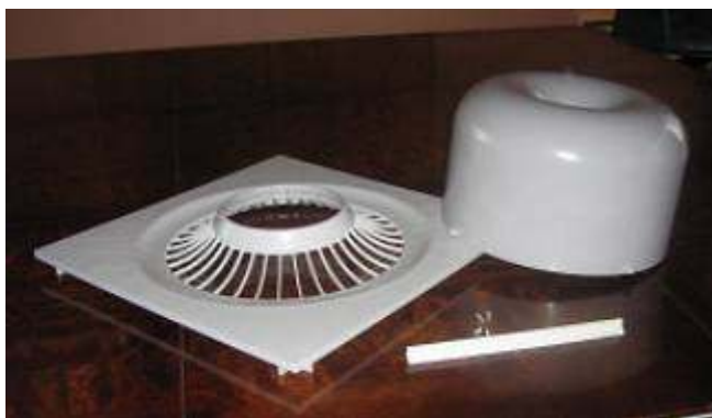
Komplet za vgradnjo v spuščeni strop, na sliki ob ravnilu dolžine 12" (305mm)

Namen vgradnje je ločiti zrak v prostoru od zraka v prostoru nad spuščanim stropom. Tako Airius enota ob delu meša le zrak iz prostora, kjer se nahajamo.